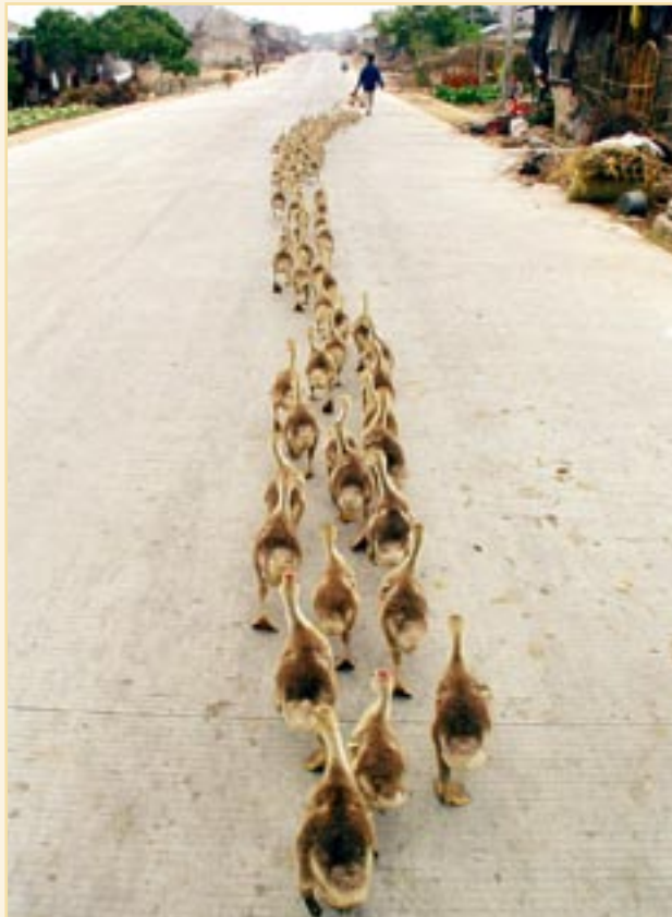
UN ÉLEVAGE DE VOLAILLE représente, dans le cas de la grippe aviaire, un domaine où les individus sont en relation constante. Ces domaines sont reliés entre eux pour former un réseau (un marché aux bestiaux, par exemple).

Comment ce modèle peut-il être adapté pour bien modéliser différents types d'épidémies ou d'épizooties ? Tout d'abord, on peut modifier le voisinage de chaque cellule, composé ici de huit cellules — les spécialistes parlent de voisinage de Moore, du nom d'Edward Moore, l'un des fondateurs de la théorie des automates. On utilise souvent un voisinage plus simple, dit de von Neumann, constitué des quatre cellules partageant un côté avec la cellule considérée. Avec ce nouveau modèle, le taux critique pour lequel une maladie devient épidémique se situe aux alentours de 60 %. On peut également améliorer le modèle en tenant compte du temps pendant lequel une cellule infectée est contagieuse, puis du taux de mortalité et d'immunité, ainsi que du temps d'immunité. On arrive ainsi à retrouver la façon dont se sont propagées des épidémies comme la peste dans l'Europe médiévale. Une première vague a tué le tiers de la population en se propageant à partir d'un épicodeur situé dans un port, suivie de plusieurs répliques plus faibles, toutes partant du même point. Ces répliques correspondent à la fin de certaines immunités.